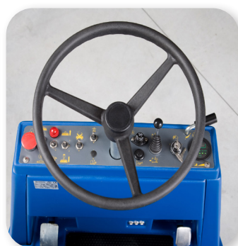
comandi semplici e intuitivi simple and intuitive controls