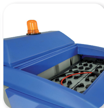
batterie con grande autonomia batteries with great autonomy