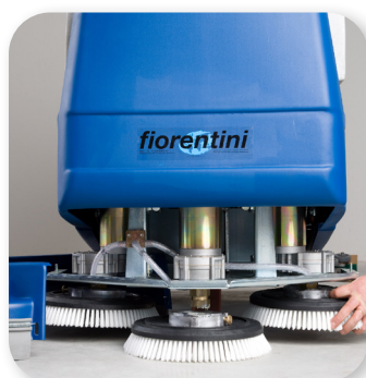
facile sostituzione delle spazzole easy brush replacement