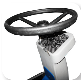
comandi semplici e intuitivi simple and intuitive controls