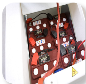
batterie al gel o acido con grande autonomia Lead acid or gel batteries with great autonomy