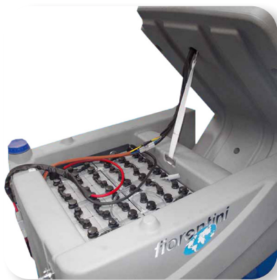
batterie al gel o acido con grande autonomia Lead acid or gel batteries with great autonomy