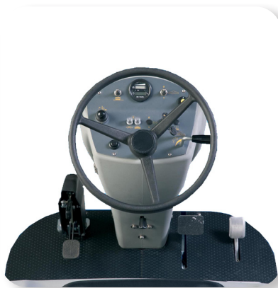
comandi semplici e intuitivi simple and intuitive controls