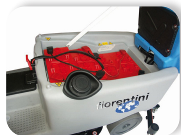
batterie al gel o acido con grande autonomia

Lead acid or gel batteries with great autonomy