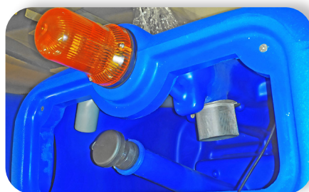
capacità serbatoio molto grande